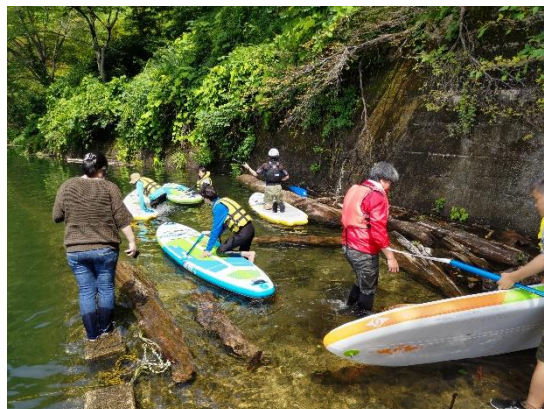
出発! 無事乗れるかな?