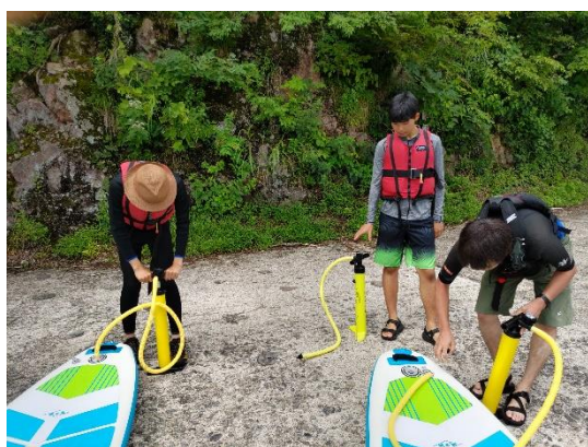
ボードに空気を入れましょう!

快晴の中、寮生、地元高校生が田子倉ダム湖でサップ体験をしました。 地元ガイドと共にウォータースポーツを楽しみました。