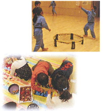
クリスマス会の様子

子ども教室は、放課後の子どもたちに安全で安心な居場所をつくるだけでなく、体験や多様な学びの場を提供しています。