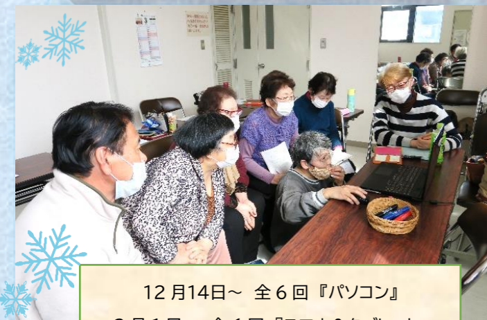
12月14日～ 全6回『パソコン』 3月1日～ 全6回『スマホ&タブレット』