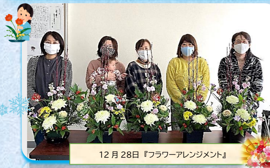
12月28日『フラワーアレンジメント』