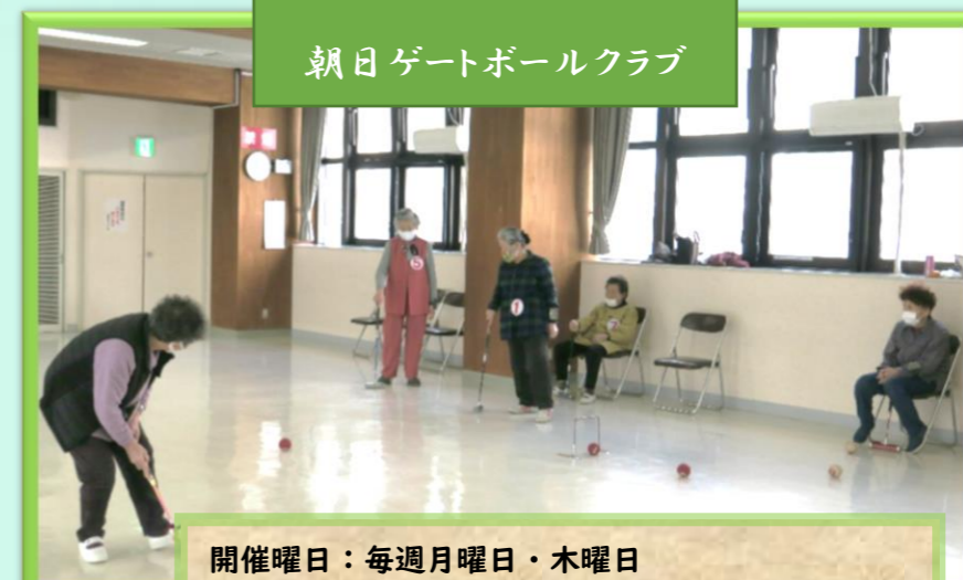
朝日ゲートボールクラブ

開催曜日：毎週金曜日 開催時間：10:00～11:30 開催場所：2Fホール or 1F農事研修室