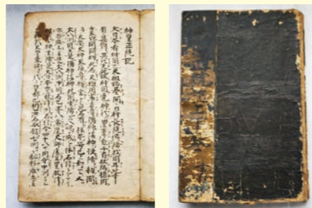
神皇正統記只見本