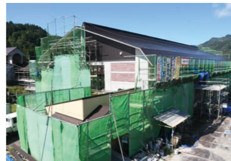
▲建設がすすめられている「ただみ・モノとくらしのミュージアム」

この2つの施設を渡り廊下で繋ぎ、一体化した施設とする計画が進んでいます。準備検討委員会では、原始時代から現代までのモノ(生活用品)を展示することにより、只見町に暮らした人々の生活・文化を表現する施設として、「ただみ・モノとくらしのミュージアム」という名称を町へ提案し、令和2年7月20日に正式決定しました。