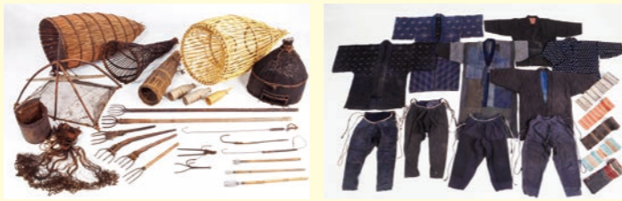
展示予定の民具等