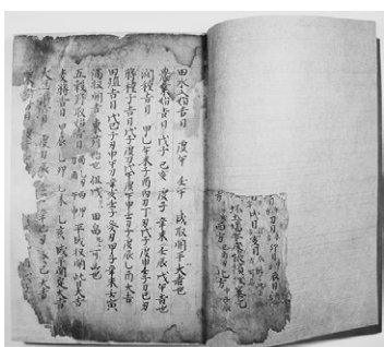
▲写真2『陰陽雑書A』修復後

破損している古典籍には、修復が必要です。写真2は、二〇〇五年に発見された『陰陽雑書A』（永禄六年（一五六三）書写、龍藏院（楢戸・山崎行弘家）旧蔵、只見町教育委員会蔵、町指定文化財）を修復した後の、前表紙見返しと冒頭です。只見町教育委員会では、京都の修復専門会社に発注して、破損していた前表紙を再建し裏打ちをしてから綴じ直しました。貴重な古典籍をよみがえらせる文化財修復事業の一環です。