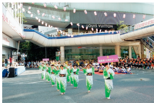
▶例年、只見町チームとして参加している柏おどり(柏まつり)

を設置し、柏産の野菜を販売するなど、本町に向けて柏の魅力を発信しています。イベント交流では、双方の魅力を伝えることはもちろん、より多くの市民・町民の皆さんに関わってもらうことを互いに意識し、相乗効果を生み出すような交流となるよう努めています。