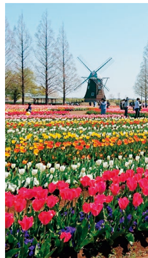
▲4月が見頃のチューリップ畑