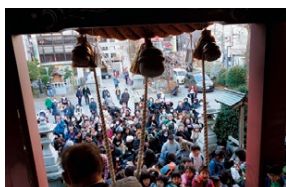
▲例年多くの人々が訪れる 柏神社の節分祭

柏駅近くにあり、古くから天王様と呼ばれ市民に親しまれてきた「柏神社」や、関東三大弁天のひとつに数えられる「布施弁天」（「あけぼの山農業公園」向かい）で初詣はいかがですか？また、毎年開催される節分行事では、福豆まきなどが行われ、多くの人々で賑わいます。