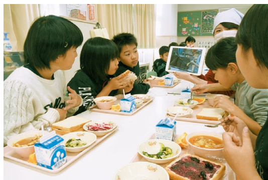
▶製造工程を学びながら柏産のブルーベリージャムを味わう児童(朝日小学校)

町の山村教育留学も柏市の協力をいただき、市内の中学生を対象とした募集を積極的に行っています。只見町教育委員会による各学校への案内・