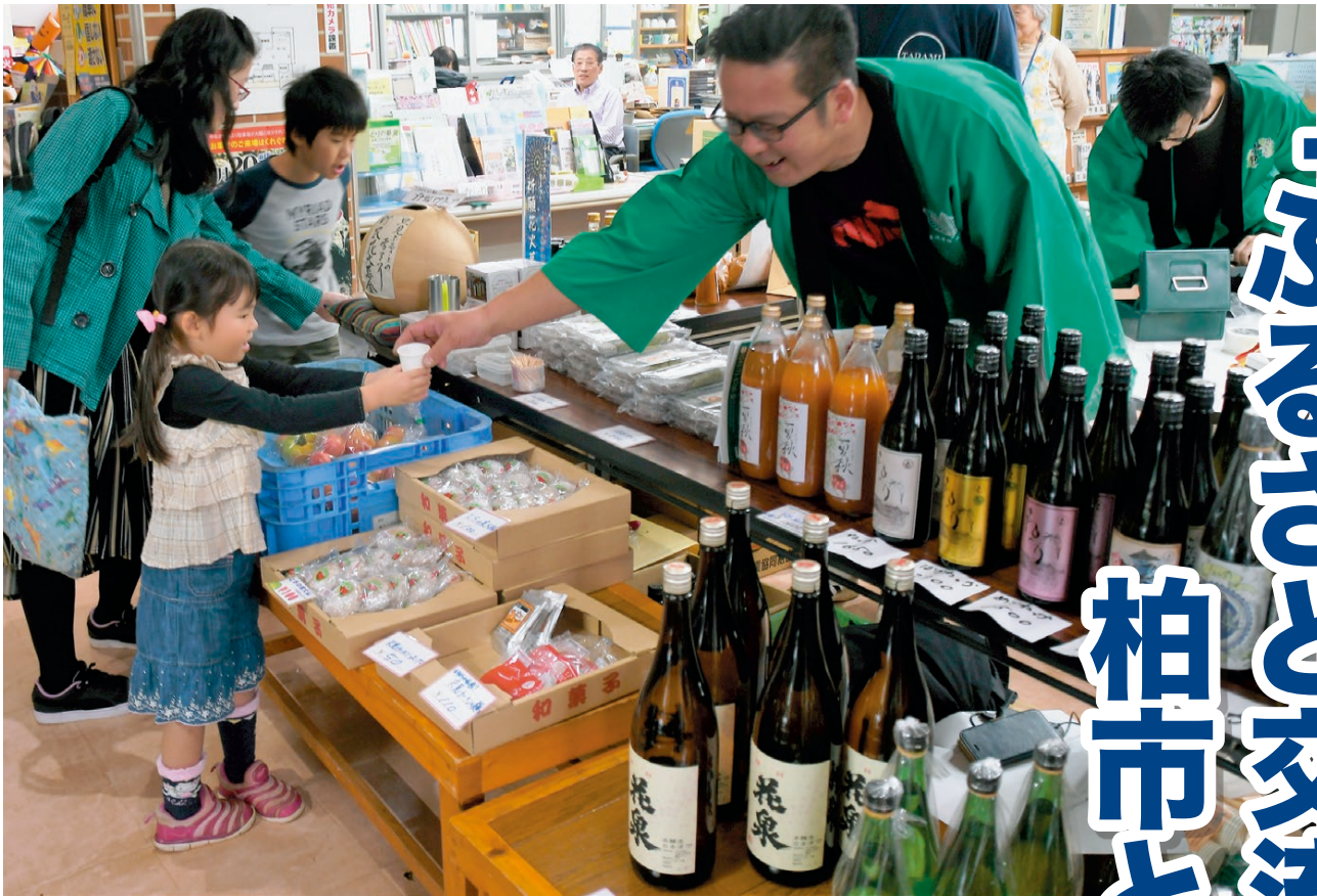
▲地域の方々と交流をしながら只見の魅力伝える（永楽台地域の文化祭）