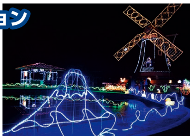
▲冬はイルミネーションが会場を照らす