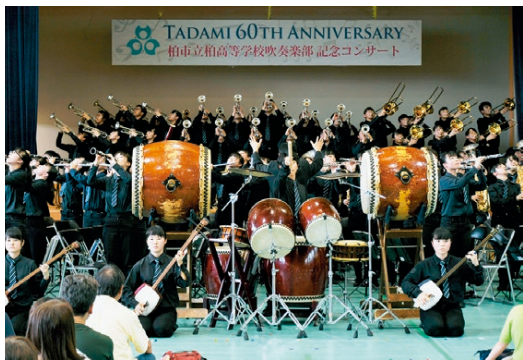
▶柏市立柏高等学校吹奏楽部によるコンサート

記憶に新しい部分で、今年7月に只見町町制施行60周年記念事業として開催された柏市立柏高等学校吹奏楽部の記念コンサートは、多くの町民の皆さんに感動を届けました。こうした交流内容は、両市町の職員が集まり、毎年開催している「只見町・柏市ふるさと交流企画会議」を中心に検討されています。また、柏市永楽台地域や酒井根地域のふるさと協議会などによる本町の視察研修も定期的に行われており、その中で新たなイベント交流に結び付く機会も増えてきています。