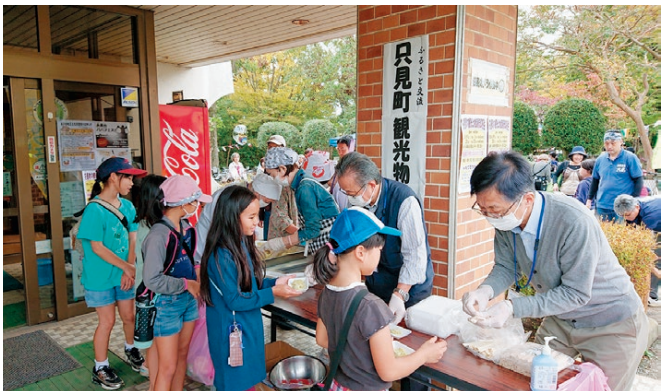
▲例年、只見町とふるさと協議会が協力して餅つき大会を行い、餅をふるまっている

永楽台地域との交流が始まった時から、同地域で物販などを行い、独自に関係を深めてきました。重要なのは、行政だけでなく、事業者や地域住民が積極的に交流をしていくことです。様々な機会です永楽台地域、そして柏市全域の皆さんに只見の魅力が伝われば良いと思います。