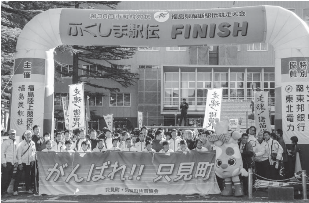
▲大会に参加した選手の皆さんとチームを支えた関係者の皆さん

以下のとおりです。只見町チームの記録は 「総合45位、町の部22位」という結果を収めました。 「総合45位、町の部22位」という結果を収めました。 只見町チームの記録は 以下のとおりです。