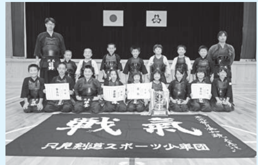
▲好成績を収めた只見剣道スポーツ少年団の皆さん