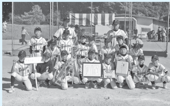
▲優勝した只見スポ少の皆さん