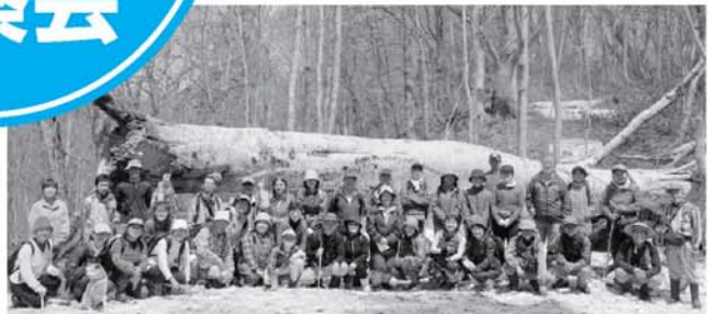
▲「国界の大ブナ 交流広場」にて記念撮影

黒谷林道から黒谷川沿いに、フクジュソウやユビソヤナギ、黒谷川のキタコブシの巨木を観察し楽しい観察会となりました。