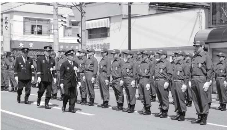
▲通常点検のようす

4月29日に南会津郡3町一カ村消防団春季連合検閲式が南会津町で行われました。 今回の連合検閲式は消防団120年・自治体消防65周年を記念して行われ只見町、南会津町、下郷町、檜枝岐村合わせて約1000人が参加し日頃の訓練の成果を披露しました。