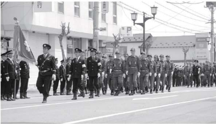
▲分列行進のようす

4月29日に南会津郡3町一カ村消防団春季連合検閲式が南会津町で行われました。 今回の連合検閲式は消防団120年・自治体消防65周年を記念して行われ只見町、南会津町、下郷町、檜枝岐村合わせて約1000人が参加し日頃の訓練の成果を披露しました。