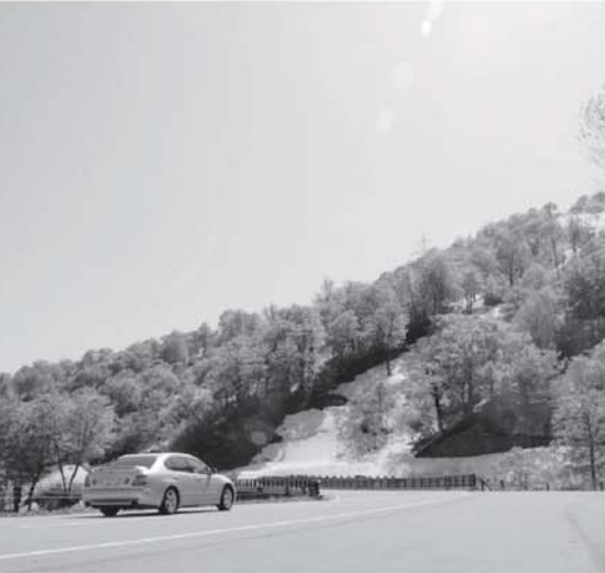
◀ 国道252号六十里越区間

冬期間通行止めとなっていました。国道252号只見・魚沼市間が5月15日から全線再開通となり、5月25日に歳時記会館で開通式典が行われました。 今年は豪雪の影響でゴールデンウィーク前の再開通が出来なかつた為、町民の方や観光客は再開通を待ちわびていたと思います。 六十里越えは綺麗な景色が続くドライブコースにもなっていますので多くの方にご利用頂きたいと思っています。