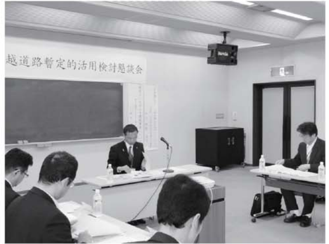
▲三条市で行なわれた懇談会のようす

今年度は只見町民や三条市民が県境を越えるイベントを7月6日に行うほか、毎年継続して行なっている只見高校生による「いわき市～新潟市」までを自転車で走破する事業も8月3日～4日に行われます。秋にはバスツアー事業も行われ観光や商工面での地域間交流の促進が図られる予定となっております。