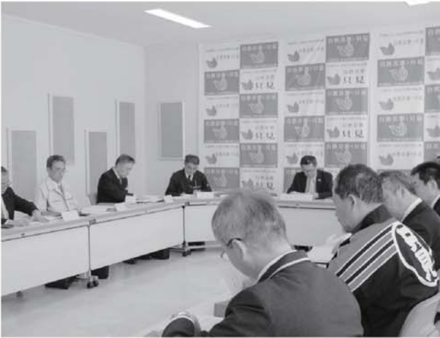
▲関係者が集まり今後の取組みについて話し合いました

6月30日には平成23年7月新潟・福島豪雨を踏まえ、町、消防団、住民、関係機関それぞれが災害時に迅速な対応ができるように水害対応防災訓練を実施し、訓練の結果は地域防災計画に反映させより実情にあった地域防災計画を策定いたします。