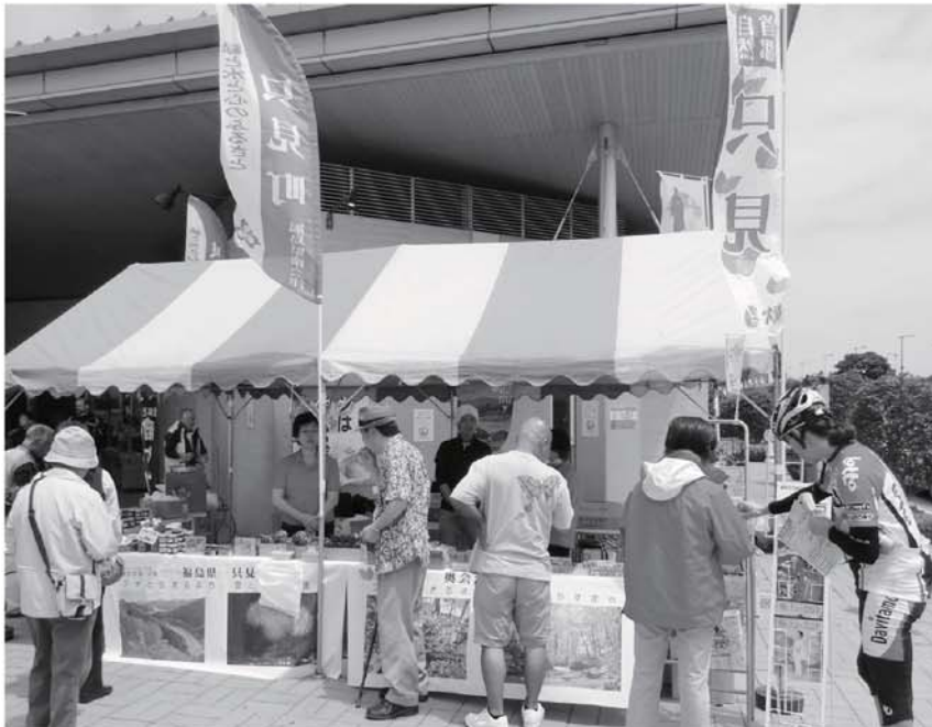
▲開設したアンテナショップ

今年度もふるさと交流都市である千葉県柏市「道の駅しよなん」に臨時のアンテナショップを開設しました。アンテナショップでは只見町の山菜や味噌、お菓子やドレッシングなどの加工品を販売しており、開設期間は5月25日～6月16日までの間で期間中は毎日販売を行なっております。