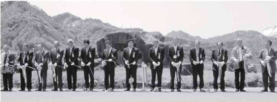
▼再開通式典でのテープカット

冬期間通行止めとなっていました。国道252号只見・魚沼市間が5月15日から全線再開通となり、5月25日に歳時記会館で開通式典が行われました。 今年は豪雪の影響でゴールデンウィーク前の再開通が出来なかつた為、町民の方や観光客は再開通を待ちわびていたと思います。 六十里越えは綺麗な景色が続くドライブコースにもなっていますので多くの方にご利用頂きたいと思っています。