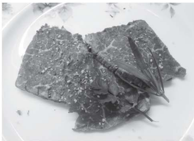
継之助が食べたと思われる牛モモ肉のローストビーフ

旧暦の八月十日と言え、現在の九月中旬にあたりますから、イモ煮の材料のネギやダイコン・サトイモが収穫できる季節です。松本良順は、ローストビーフのほかに背ロースとか、ばら肉なども持ってきたかもしれません。材料がそろえば、牛肉入りのイモ煮を作ること可能です。山形県で