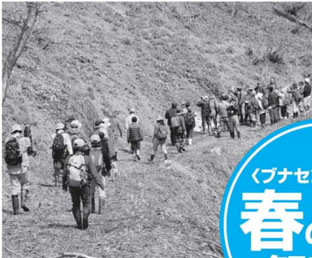
▲ 黒谷林道のフクジュソウ大群落