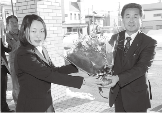
▲職員から花束を受け取る目黒町長(右)

目黒町長の2期目となる任期は、平成24年12月16日から平成28年12月15日までです。