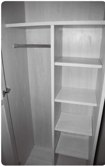
③ 玄関 (収納スペース)