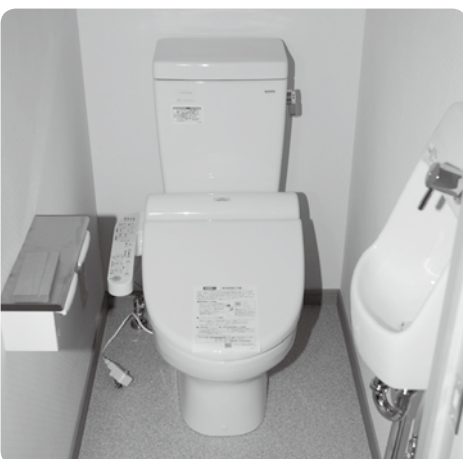
⑤ トイレ (洋式)