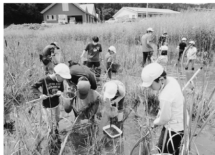
地域の自然や文化を学ぶことを通して持続可能な社会を考える教育