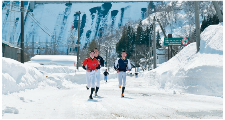
▲積雪の道路でロードワークする選手