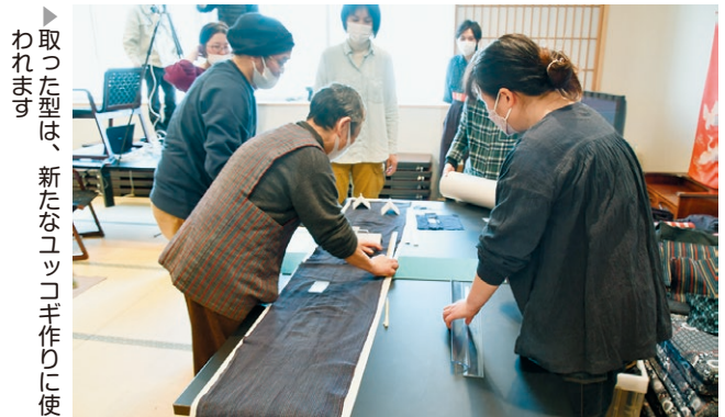
▶ 取った型は、新たなユッコギ作りに使われます