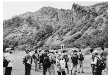
自然や伝統文化を活かしたエコツーリズム・グリーンツーリズム