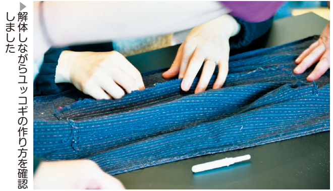
▶ 解体しながらユッコギの作り方を確認しました