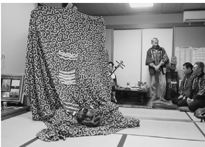
集落での伝統行事・伝統芸能の継承（小林神楽）