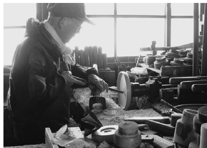
地域の資源や伝統技術を使ったお土産の開発・販売・ブランド化（伝承産品：るくる木地）