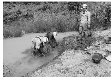
民間企業による野生動物の保全に配慮した工事施工

ユネスコエコパークの活動に関するご相談は只見町役場地域創生課ユネスコエコパーク推進係（電話0241-82-5220）までお気軽にお問い合わせ下さい。