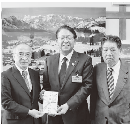
▽25日来庁された押部金山町長(左)、五ノ井議長