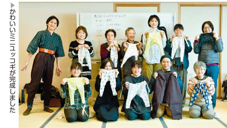
▶ かわいいミニユッコギが完成しました

第2回ワークショップでは、ユッコギの型取りやミニユッコギ作りなどが行われました。 参加者は、ユッコギが1本の反物から無駄なく作られていることを確認するなど、ものを大切に作る工夫と精神に感心していました。 またワークショップ中では、実際にユッコギを作るためのデザインなどの検討も行われました。 今後も只見町の貴重なユッコギを伝承する取り組みを進めていきます。