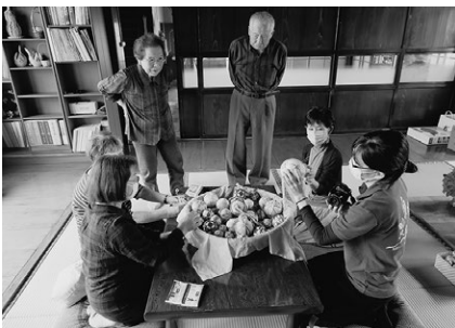
ちよの会（民間団体）による手毬（伝統文化）の復活と商品化

このような小さな取り組みの地道な積み重ねが只見町のユネスコエコパークの魅力を輝かせ、只見町の明るい未来を描くことに繋がるはずです。