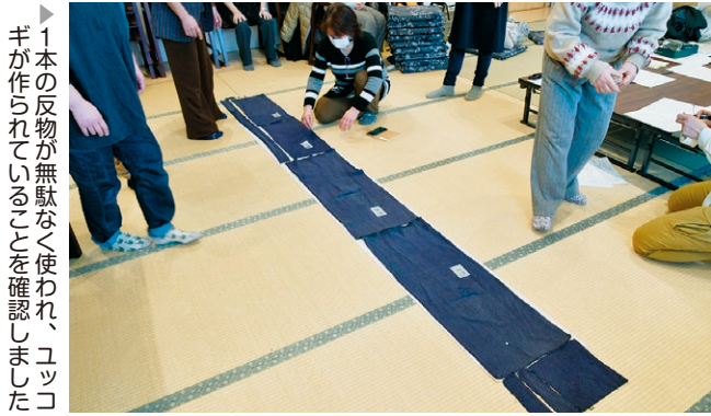
▶ 1本の反物が無駄なく使われ、ユッコギが作られていることを確認しました