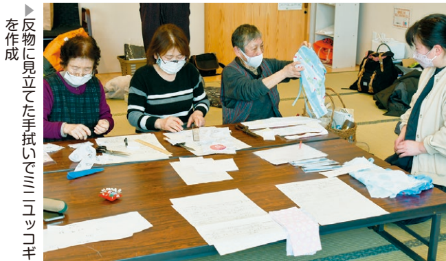
▶ 反物に見立てた手拭いでミニユッコギを作成