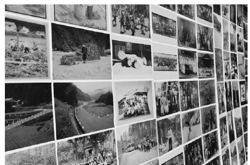
▲自然だけでなく人々の魅力的な暮らしも写されています