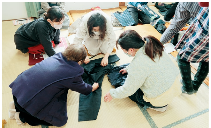
▶ユツコギの作りを確認する参加者