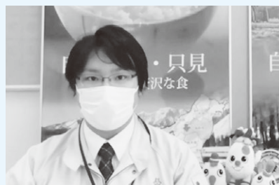
▲自身の経験などを紹介した只見町の職員