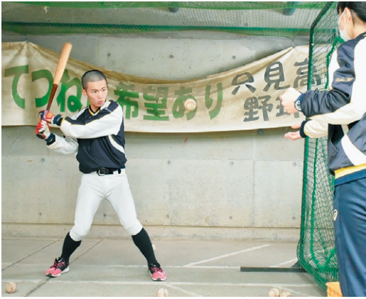
▲ピロティで練習する選手