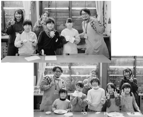
▲「バレンタイン・ホワイトデー大作戦」では、美味しく可愛いスコーンができました

森林の分校ふざわ主催の「バレンタイン・ホワイトデー大作戦」（1月30日）と「ボードゲームCafé」（2月19日～27日までの土日祝）が開かれました。