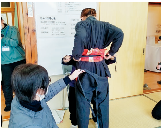
▶ユツコギを試着する参加者

素材には木綿が主に用いられ、動きやすいように細く仕立てられています。冬期間は、太くゆったりしたものに仕立てて着用します。こちらは「ダフツパカマ」「ダフユツコギ」「ブタユツコギ」などと呼ばれていました。