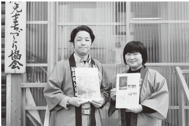
▲新しいパンフレットは、只見町観光まちづくり協会でも配布しています。

自然首都・只見誘客推進事業実行委員会で作成している只見町観光パンフレットがリニューアルされ、4月1日より宿泊施設や観光施設などでの配布が始まりました。町の情報を「体験」や「歴史」などのジャンルごとに紹介するほか「おすすめ周遊プラン」が掲載され、より分かりやすく、見やすくなりました。只見町を紹介する際に、ぜひご利用ください。