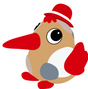
只見町キャラクター 「アカショウちゃん」