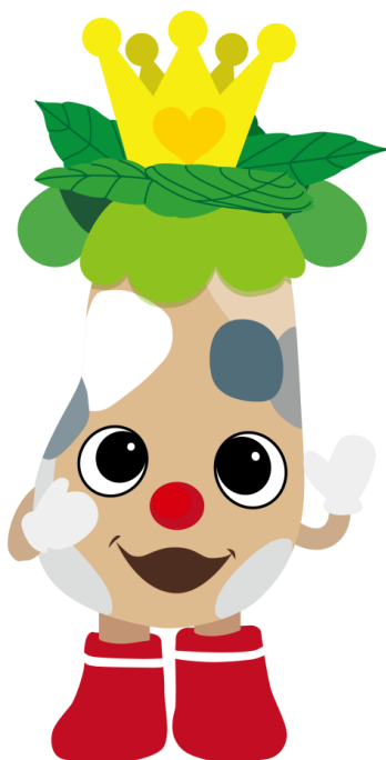
只見町キャラクター「ブナりん」