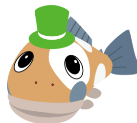
只見町キャラクター 「イワッペ」