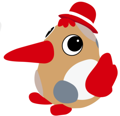
アカショウちゃん