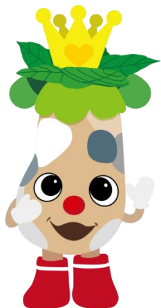
只見町キャラクター 「ブナりん」