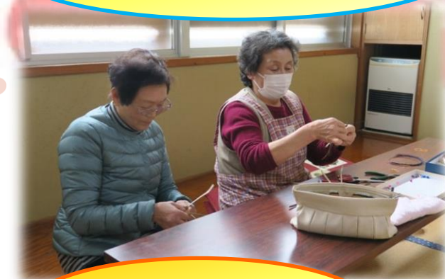
つる細工体験コーナー