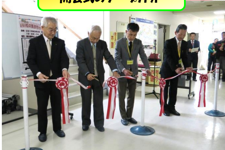
開会式のテープカット