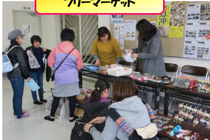
フリーマーケット