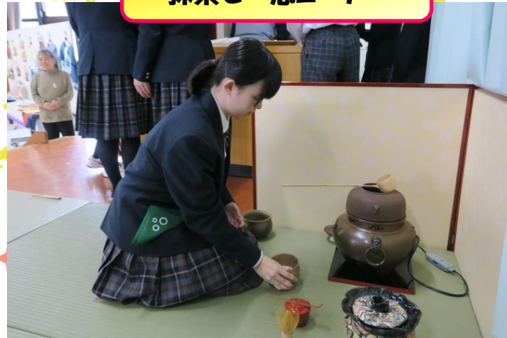
抹茶で一息コーナー