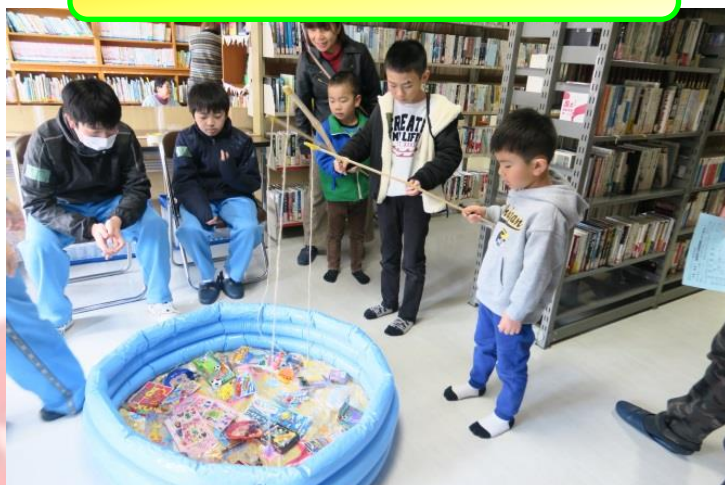
おもちゃ&おかし釣りコーナー