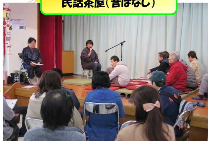
民話茶屋(昔ばなし)