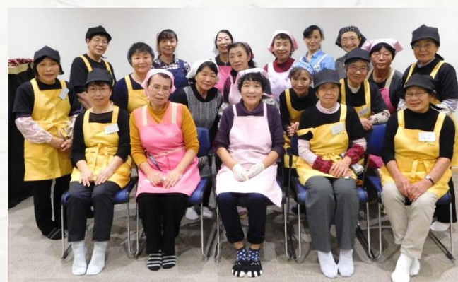
講師:新潟県魚沼市 ゆのたに茶々の会のみなさん

10月22日(火)に18名が参加。今年度で4回目となる本講座では『南蛮みそのコシヒカリピザ』と『米粉クレープ』の作り方を教えていただきました。