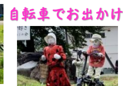
自転車でお出かけ