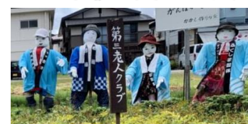
ハッピーも着こなしています