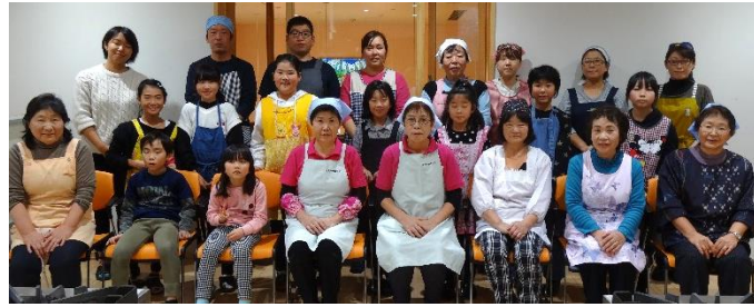
講師: 只見町そば部会の皆さん

12月8日(日)【午前】9:00~そば打ち: 大人10名、チャレンジ隊8名、お子様2名 【午後】1:00~しめ飾り: 大人17名、チャレンジ隊9名