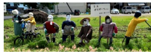
家族総出での農作業スタイル