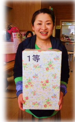
おめでとうございます