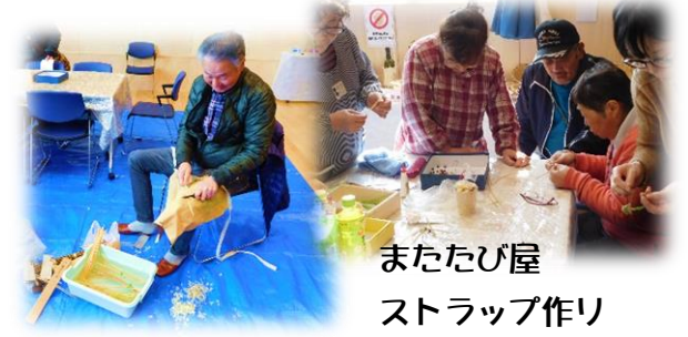
またたび屋 ストラップ作り