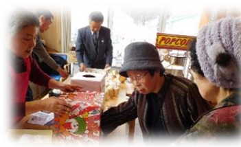
スタンプラリー抽選会