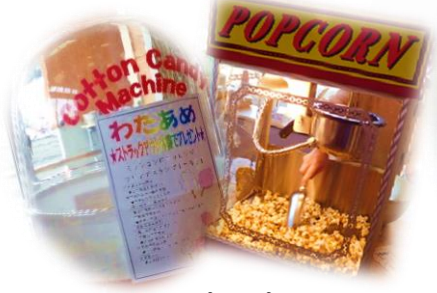
わたあめ&ポップコーン