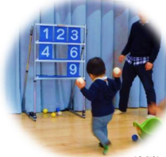
ストラックアウト体験