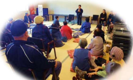
昔話 (只見町むかし話しの会の皆さん)