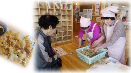
五目ぶかし・とん汁販売