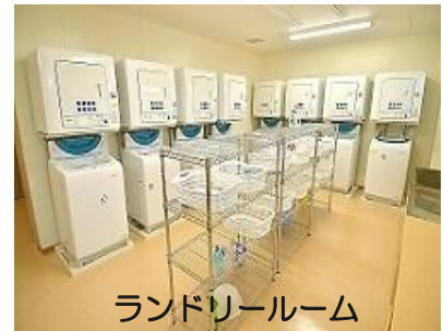
ランドリールーム