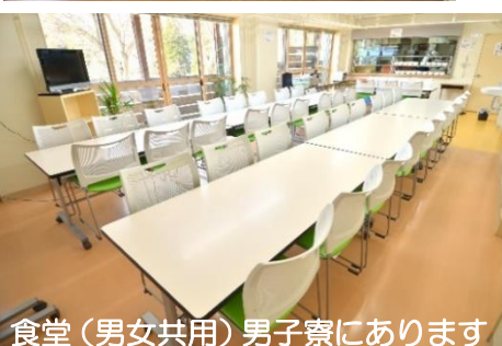
食堂（男女共用）男子寮にあります