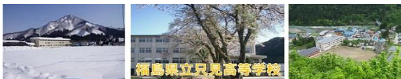
福島県立只見高等学校

今年も「体験入学」「見学会」の時期です 寮「見学会」では 食堂、女子寮ラウンジ を使用し 下記の時間帯は使用できません 9/18(土)、19(日) 10:00-12:00