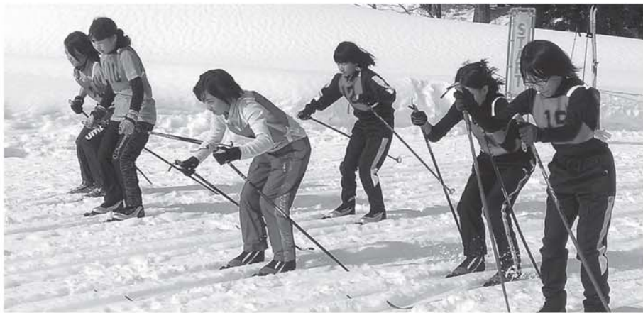
▲抜きつ抜かれつで声援が飛び交い盛り上がった小学生女子の距離リレー

2月11日、只見スキー場で今年で53回目となる町民スキー大会が行われました。昨年は雪崩の危険性があり中止となりましたが、今年は天候にも恵まれ絶好のスキー大会日和となり、大会出場者は、昨年滑れなかった分も取り返そうと一生懸命競技に取り組んでいるようでした。 大会の成績は次のとおりです。