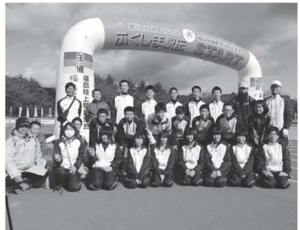
▲スタート地点での集合写真