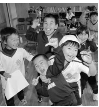
▲ 昼休みの教室で(新校舎)