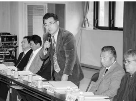
▲質疑応答で意見を述べる区長