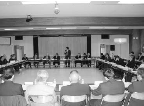
▲意見交換が行われた町政報告会

続いて、各担当課長などから本年度主要事業についての説明が行われ、質疑応答に入りました。質疑応答では、集落担当職員配置、スクールバスの運行要望、廃屋の撤去対策、公共施設の再配置計画、只見中学校道路改良、国道289号黒谷地区の歩道整備などについて、活発な意見交換があり、担当課長などから現状の報告や、今後の進め方、方針などの説明が行われました。