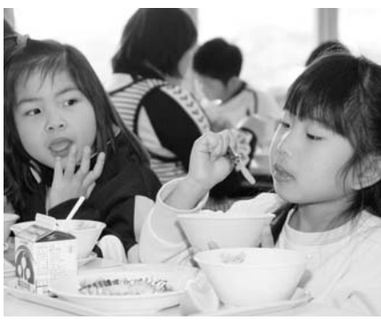
▲ ランチルームでの楽しい給食(新校舎)

旧明和小学校の建設は、昭和37年2月に用地確保、同年8月に着工し、39年3月に完成を見ました。沿革誌によると、39年3月2日「新校舎移転と移転式」とあります。途中、昭和47年11月には「創立100周年記念式典」が挙行されました。地域に支えられ、児童を温かく見守り育ててくれた旧明和小学校校舎の45年間に心から感謝したいと思います。