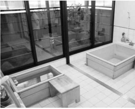
▲新しい青森ヒバのお風呂