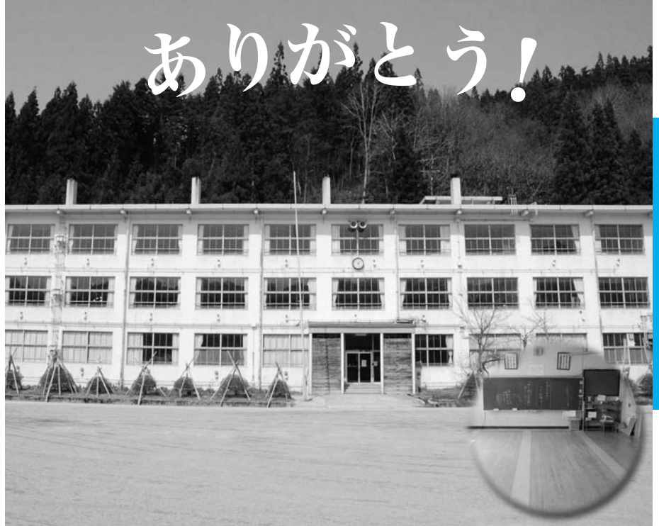
⑩ 明和小学校校舎(昭和39年完成)