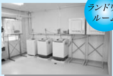
ランドリールーム