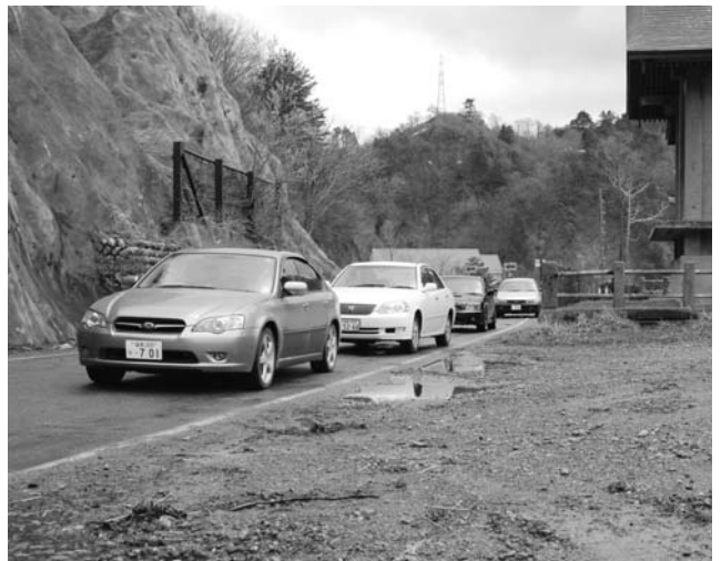
▲ 田子倉展望台から新潟方面に向かう乗用車

積雪のため冬期間通行止めとなっていた国道252号(田子倉～新潟県境)が再開通しました。昨年に続き、大型連休前に通行可能となり、残雪の山々や新緑に囲まれた田子倉湖の景色が、今年も観光客を楽しませてくれそうです。田子倉展望台の桜も見ごろを迎えようとしていました。只見を代表する観光地にも本格的なシーズンの到来です。