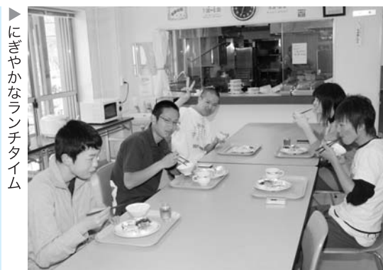
にぎやかなランチタイム