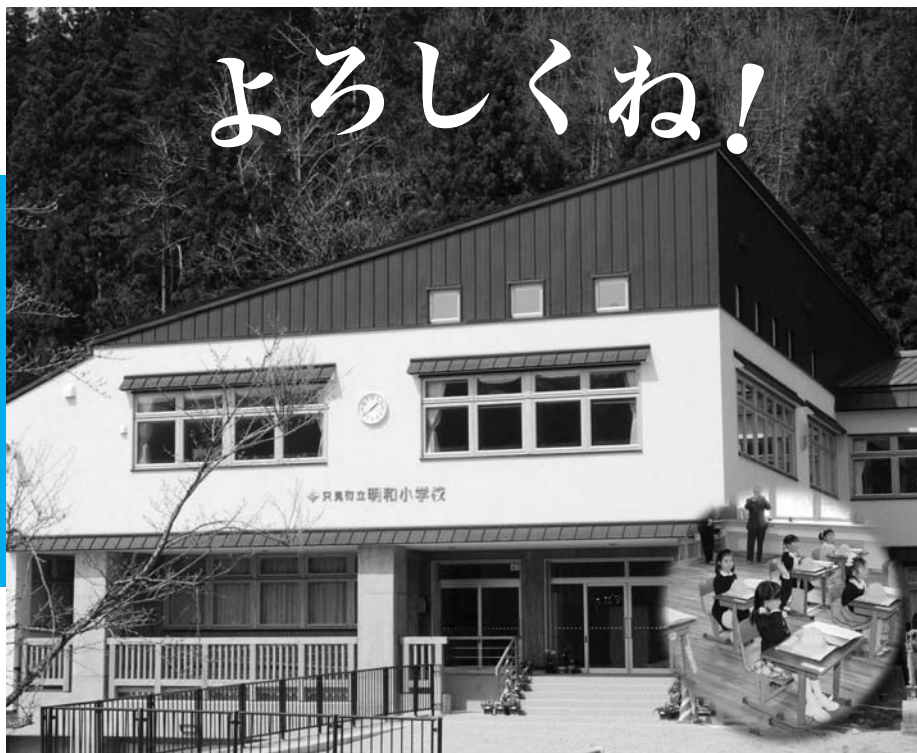
(新) 明和小学校校舎(平成21年完成)

昨年、旧明和中学校を明和小学校の新校舎に改築する工事が進められてきました。工事も順調に進行し、本年3月に新明和小学校が誕生、4月には新1年生7名も入学し生まれかわった明和小学校の記念すべき1ページが開きました。