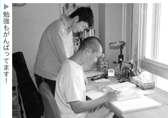
勉強もがんばっています！