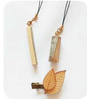
▲ブナ材クラフト体験