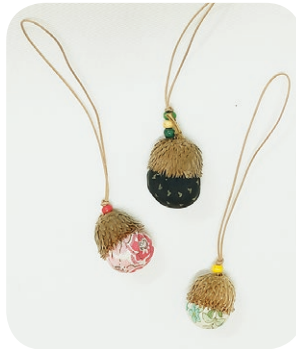
▲ぜんまい綿のストラップ