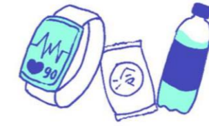
ウェアラブル端末、 応急セット