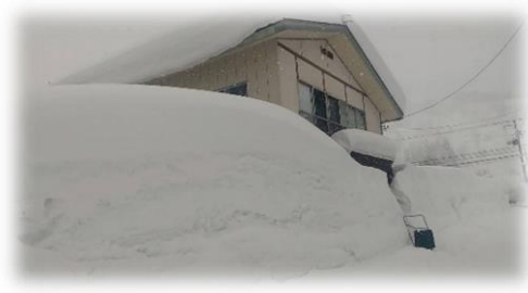
只見地区民家 積雪時

晴れた日は、気分も上がりホッとしますが、陽が差し気温が上がると、屋根に乗っている雪が一気に落ちるので、軒下近くを通る時や、除雪作業では注意が必要です。町の防災無線でも冬の晴れた日には、注意喚起の放送がありますので、気を付けましょう。