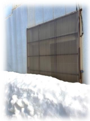
透明な波板の雪囲い