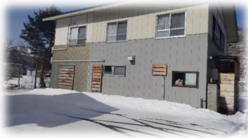
只見地区民家 冬晴天時

早い年で 11 月下旬から雪が降り始め、日陰だと 4,5 月頃まで雪が残ります。大雪の日は、1 日で 80cm 以上雪が積もったりもします。ただ、冬の間毎日雪が降っているわけではなく、晴れて陽が差す日もあります。