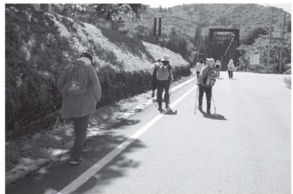
▲それぞれのペースで歩く参加者

この事業はただ歩くだけではなく、2本のポール（ストック）を使って歩くノルディックウォーキングという歩き方で行われました。ノルディックウォーキングはポールを使う事で膝や腰などへの負担が軽減されるため年齢性別を問わず誰でも楽しむ事が出来ます。また、リハビリやダイエットにも効果的な歩き方ですので、広報ただみ診療所を読んで「運動をしてみようかな？」と思った方はぜひチャレンジして欲しいと思います。ポールは保健福祉課で貸し出していますのでお気軽にお問い合わせください。