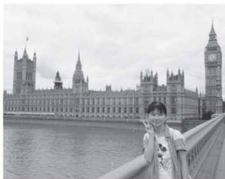
▲ビッグベンをバックに一枚