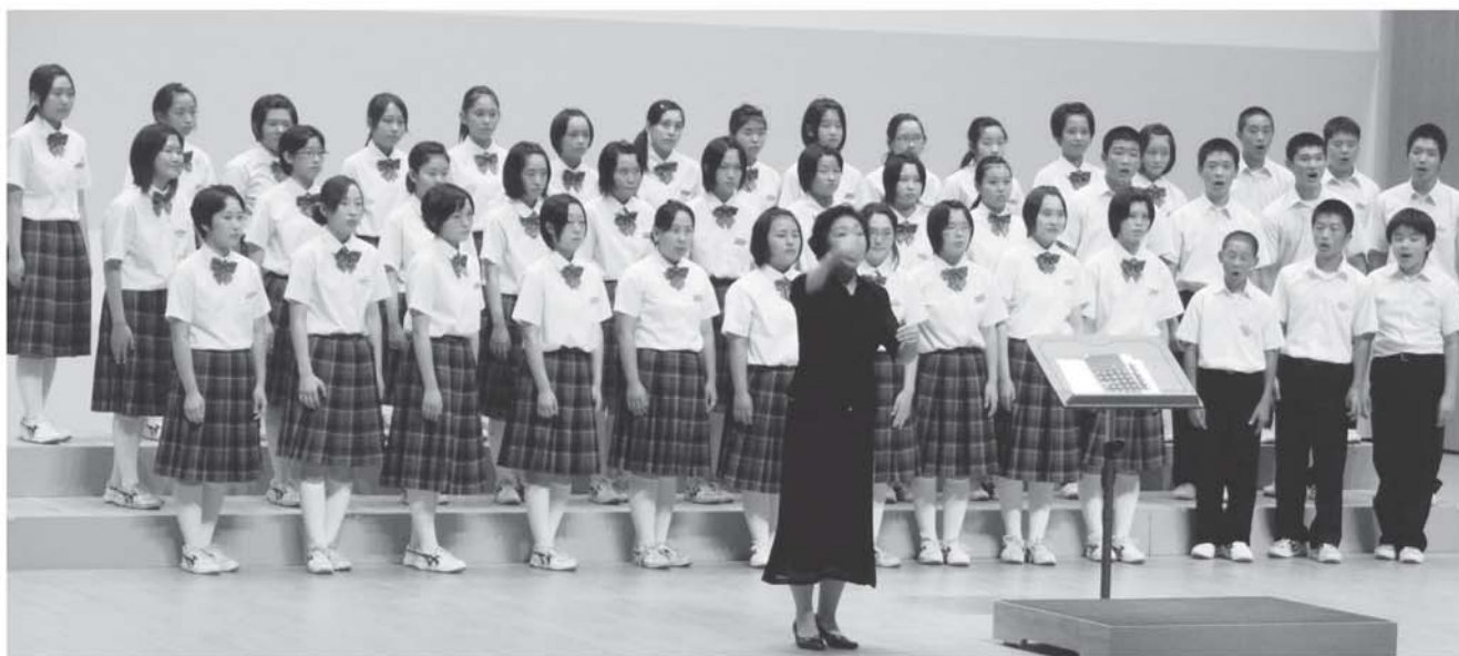
▲練習を重ね素晴らしい歌声を披露する生徒達

9月5日にいわき市の芸術文化交流館アリオスで開催された県大会では練習を重ねた素敵な歌声を披露し、この様子はテレビでも放映されました。