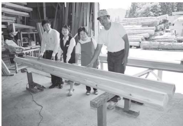
▲酒井建設でのスギ材引き渡しの様子