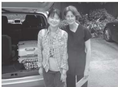
▲ホームステイ先の方と一緒に