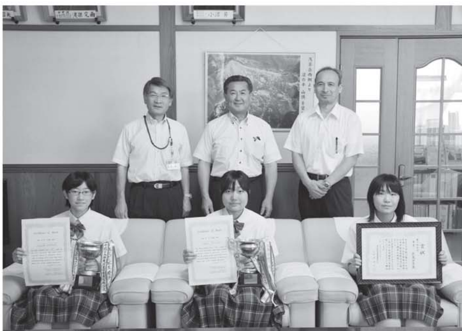
▲町長に県大会出場の報告をしてくれました

只見中学校の生徒数は決して多くはありませんが、努力や練習を重ねる事で様々な大会で結果を出す事は素晴らしい事だと思います。