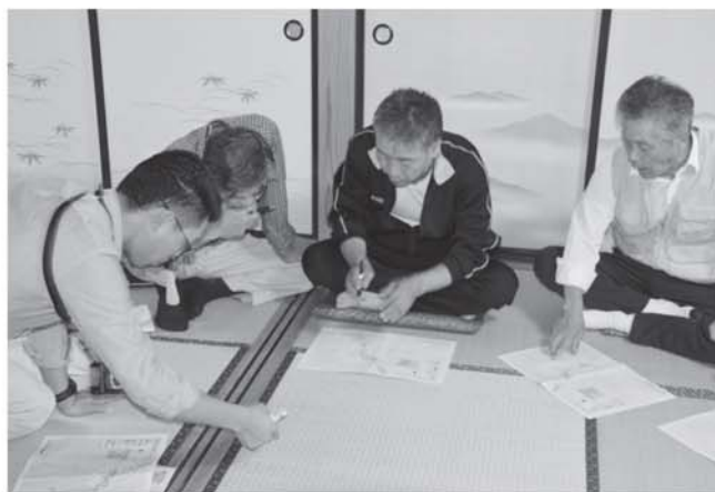
▲黒谷入地区での聞き取り調査の様子

皆様からの貴重なご意見は、ハザードマップの見直しに反映させて頂きます。ご協力頂きありがとうございました。