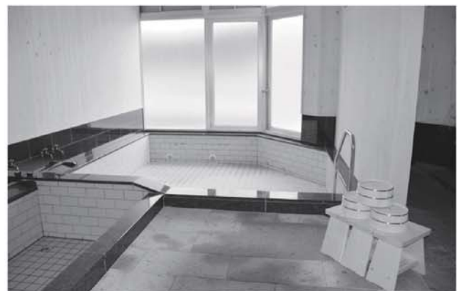
▲綺麗になった浴室