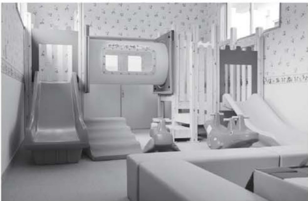
▲新設されたキッズスペース

設されました。また、キッズスペースとしてすべり台などの遊具が置かれた部屋や個室も新設されるなど様々な年代の方が利用できる施設となりました。 食事メニューも豊富で価格もリーズナブルですので、ご家族やご友人など多くの方々に「ひとつぶるまぢ湯」をご利用頂き、この施設を町民の方々の憩いの場として欲しいと思います。