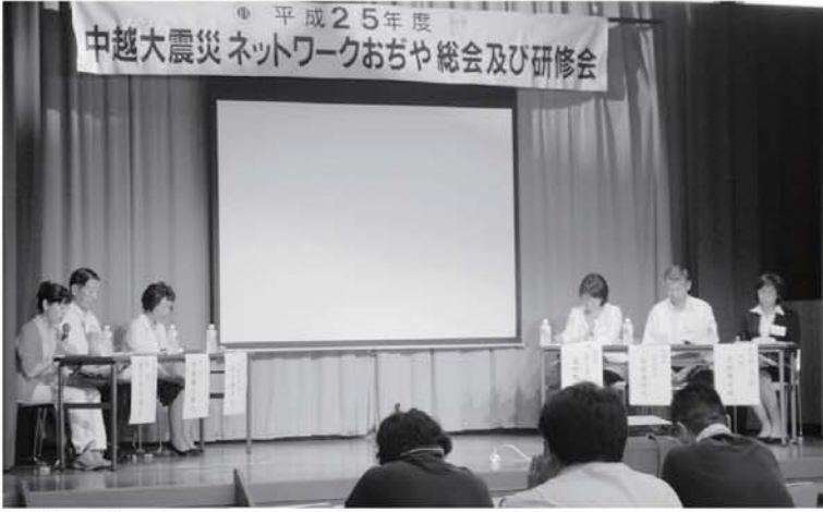
▲パネルディスカッションの様子

平成25年度「中越大震災ネットワークおぢや」の総会及び研修会が8月1〜2日にかけて季の郷 湯ら里で行われました。このネットワークは、小千谷市が事務局となり、中越大震災後の平成17年に設立され全国71自治体が加入しています。2日の研修会は公開プログラムとしてテーマを『「元気」が支える地域の再建』とし、パネルディスカッションが行われました。パネリストは東日本大震災で被災された気仙沼市の(有)オйкаワデニム代表