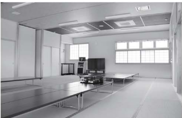
▲ゆっくりくつろげる大広間