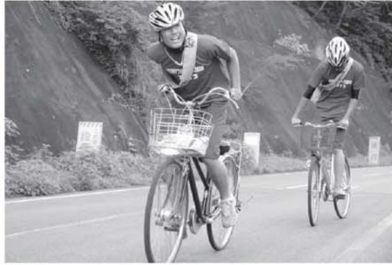
▲つらい登り坂も頑張りました

2日目は只見町役場を出発し叶津へ。八十里越区間を越え三条市役所からは目黒町長、国定三条市長とともにゴールの新潟県庁を目指しました。 生徒たちは無事にゴールし、この真夏のイベントを大成功させました。