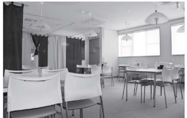
▲清潔感のある食堂